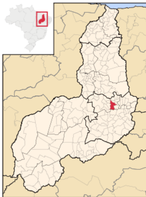
Figura 1 Mapa do Piauí, com destaque para a cidade de Picos.

Cortado pelo trecho Inicial da Transamazônica, Picos, principal entroncamento rodoviário do Nordeste, liga o Piauí ao Maranhão, Ceará, Pernambuco e Bahia. Tem como limites, os municípios de Santana do Piauí e Sussuapara ao norte, ao sul Itainópolis, a oeste Dom Expedito Lopes e Paquetá e a leste Sussuapara e Geminiano. A sede municipal tem as coordenadas geográficas de 07°04'37" de latitude e 41°28'01" de longitude oeste de Greenwich e 190 m de altitude. O município de Picos está inserido no Vale do Guaribas, dentre os territórios do Estado do Piauí, segmento localizado no Semiárido piauiense, composto por 36 municípios.